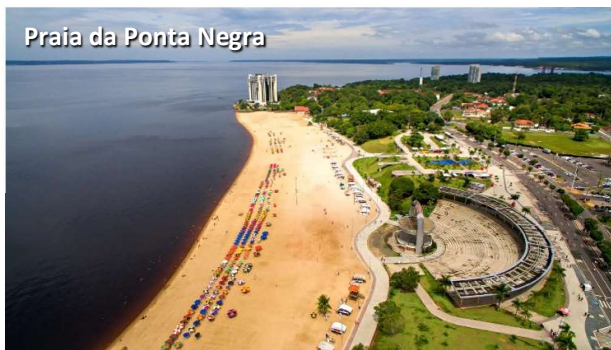
Praia da Ponta Negra