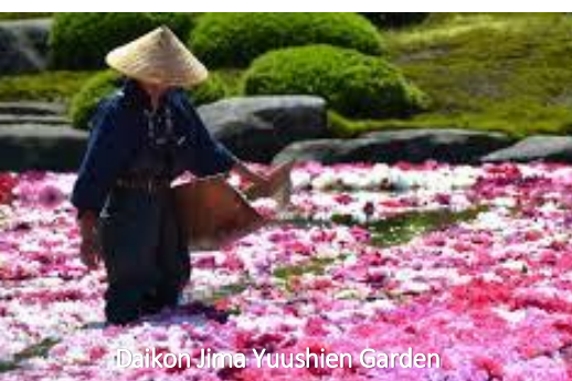
Daikon Jima Yuushien Garden