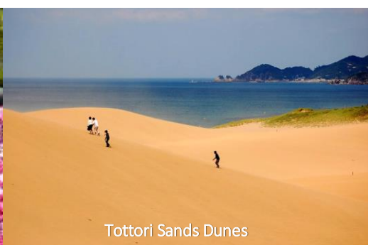
Tottori Sands Dunes