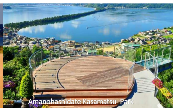
Amanohashidate Kasamatsu Park